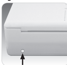
Fig.2 - Face arrière

Interrupteur pour lancer le cycle de séchage