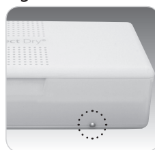
Fig.3 - Face avant

Voyant vert allumé = cycle de séchage activé